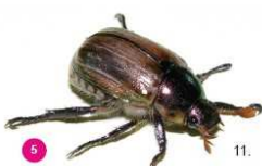
5 Mimela junii Il giugnino Mimela junii , 13-16 mm, possiede elitre di colore verde dorato e molti peli diffusi che non si distinguono in ciuffi bianchi. Ha una forma più ovale rispetto al coleottero giapponese.